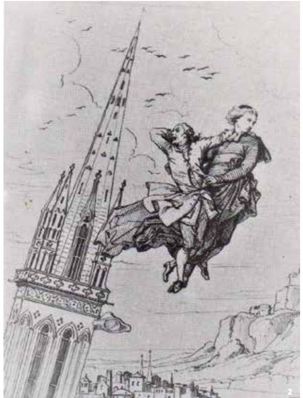
1 - Fachada con el campanario 2 - El padre Poussinière volando por los aires...