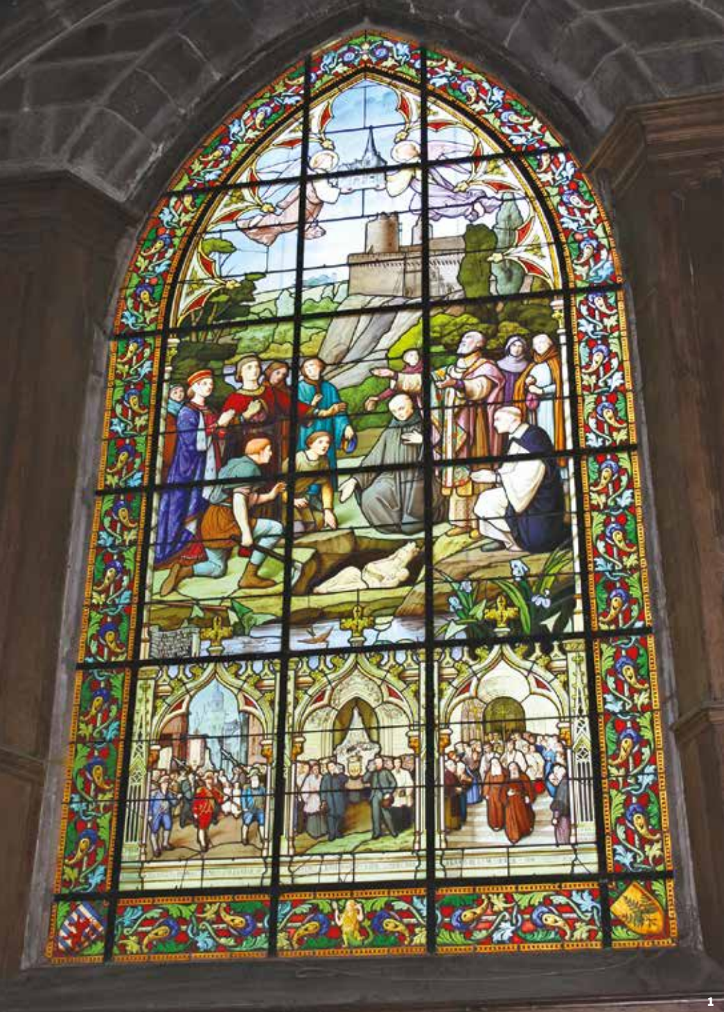
1 - Descubrimiento de Nuestra Señora de las Marismas