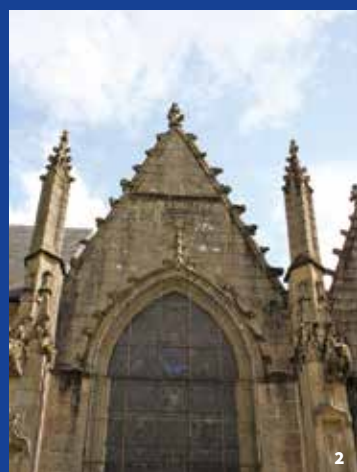
1 - Iglesia en el recinto 2 - Piñón decorado