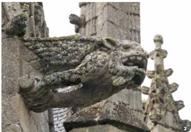
1 - Vista general de la iglesia de San Sulpicio 2 - Gárgola

Además de las monstruosas gárgolas, una decoración de extraños personajes y pequeños animales singulares da vida a esta fachada y recuerda el carácter a veces burlón de los escultores de la Edad Media.