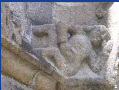
1 - Puerta Melusina 2 - Bajorrelieve: la gula

Alrededor del coro, pequeñas esculturas, como «La Gula», simbolizan los siete pecados capitales.