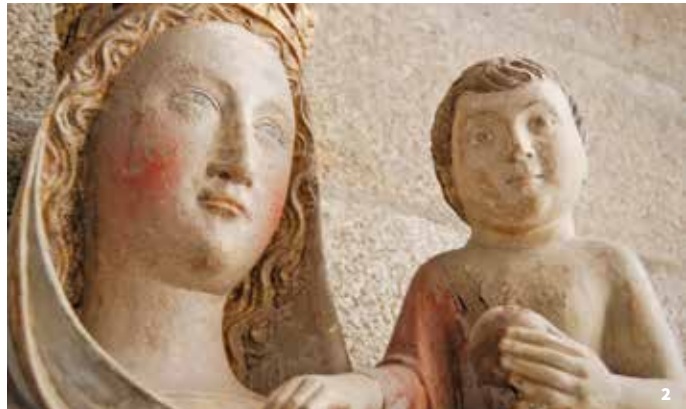
1 - El retablo de los curtidores 2- Virgen con el Niño