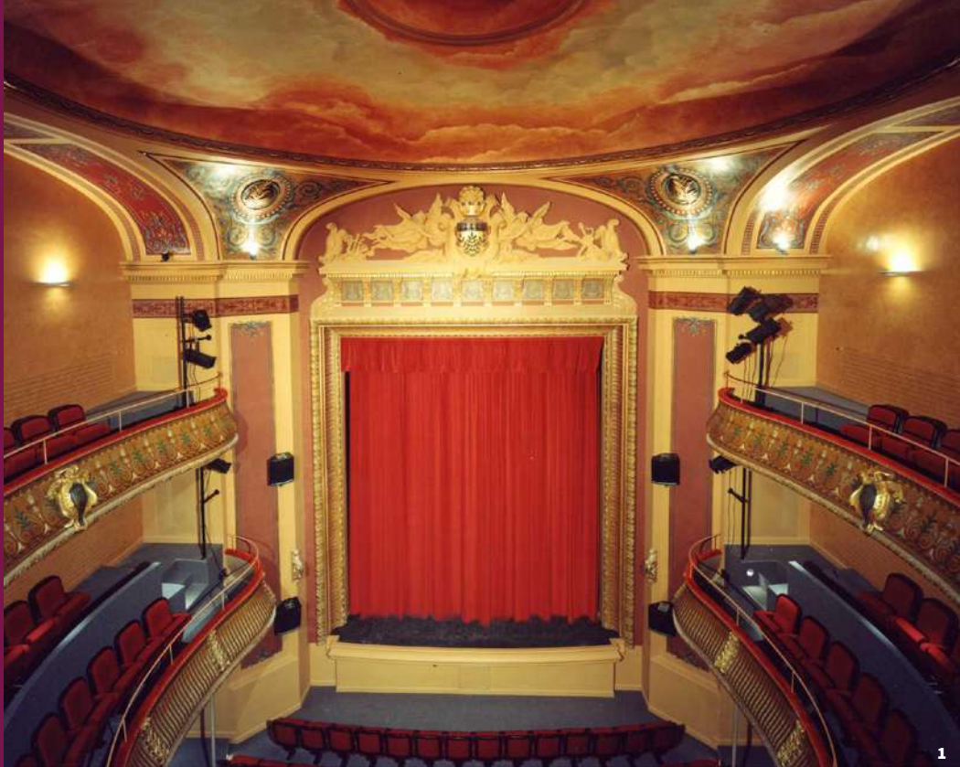
1 - Cadre de scène 2 - Le foyer

Le cadre de scène concentre une luxueuse décoration de moulures peintes. Au-dessus, au centre du fronton, deux anges portent les armes de la ville et des instruments de musique, agrémentant les extrémités.