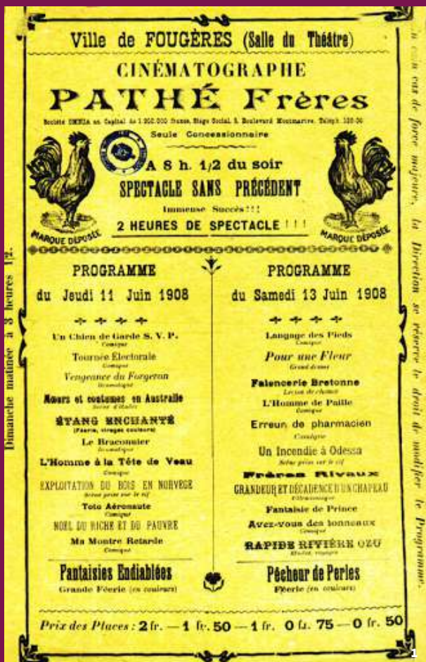
1 - Affiche cinéma