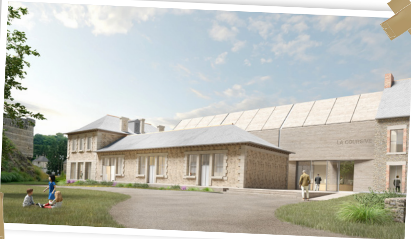
Vue 3D de l'extérieur de la Coursive - ©Projectiles

La Coursive, nouvel équipement culturel emblématique de Fougères, s'affirme comme un centre d'interprétation de l'architecture et du patrimoine. Situé au cœur de la ville, ce lieu unique offre aux visiteurs une immersion dans l'histoire locale, présentant un parcours de découverte chronologique, des expositions et des animations thématiques. La programmation variée se veut transversale, incluant des conférences, des ateliers créatifs et des visites guidées, favorisant ainsi l'échange et la découverte. La Coursive devient un véritable point de rencontre pour les passionnés d'histoire et d'architecture mais également pour les curieux de passage, contribuant à valoriser le patrimoine et l'identité fougèraise.