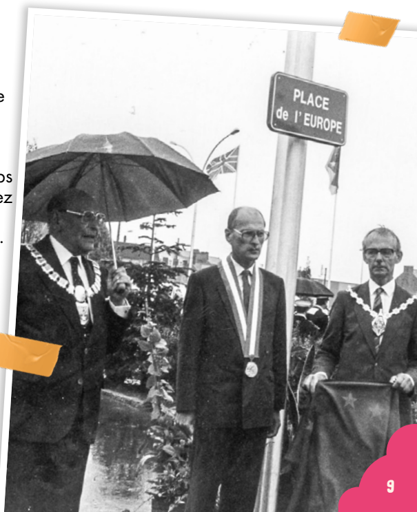
Jumelage, inauguration de la place de l'Europe (1987), maires de Bad Münsterreifel, Fougères et Ashford

♿ Les photographies font partie intégrante des fonds d'archives au même titre que les documents écrits. Témoins de la petite et de la grande Histoire, des évolutions et permanences des modes de vie et paysages, elles sont une source inestimable pour l'histoire de Fougères. Photographies amateurs, professionnelles, institutionnelles, photographies de presse, cette causerie vous propose une plongée dans les riches collections photographiques des Archives municipales.